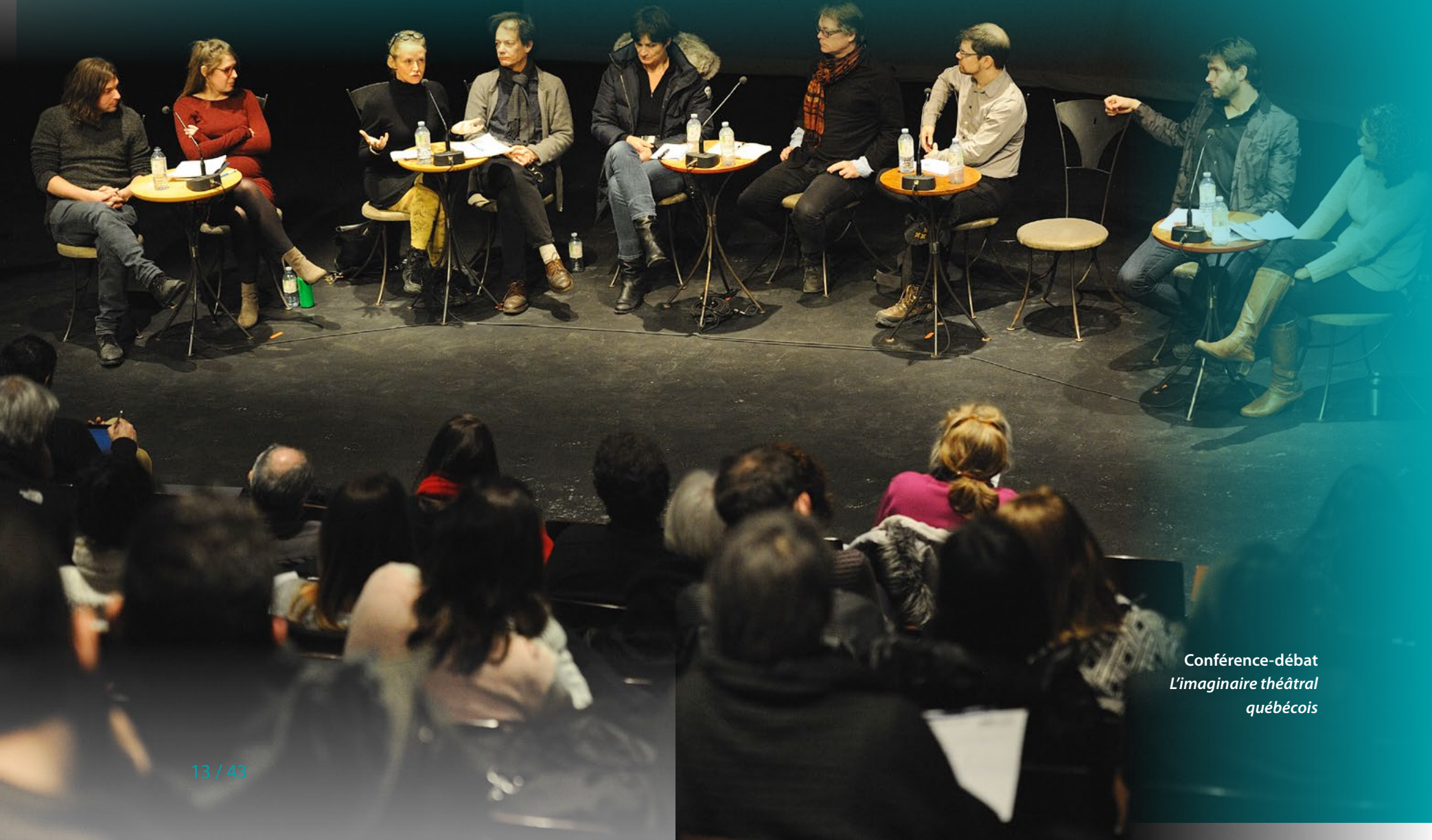
Conférence-débat L'imaginaire théâtral québécois