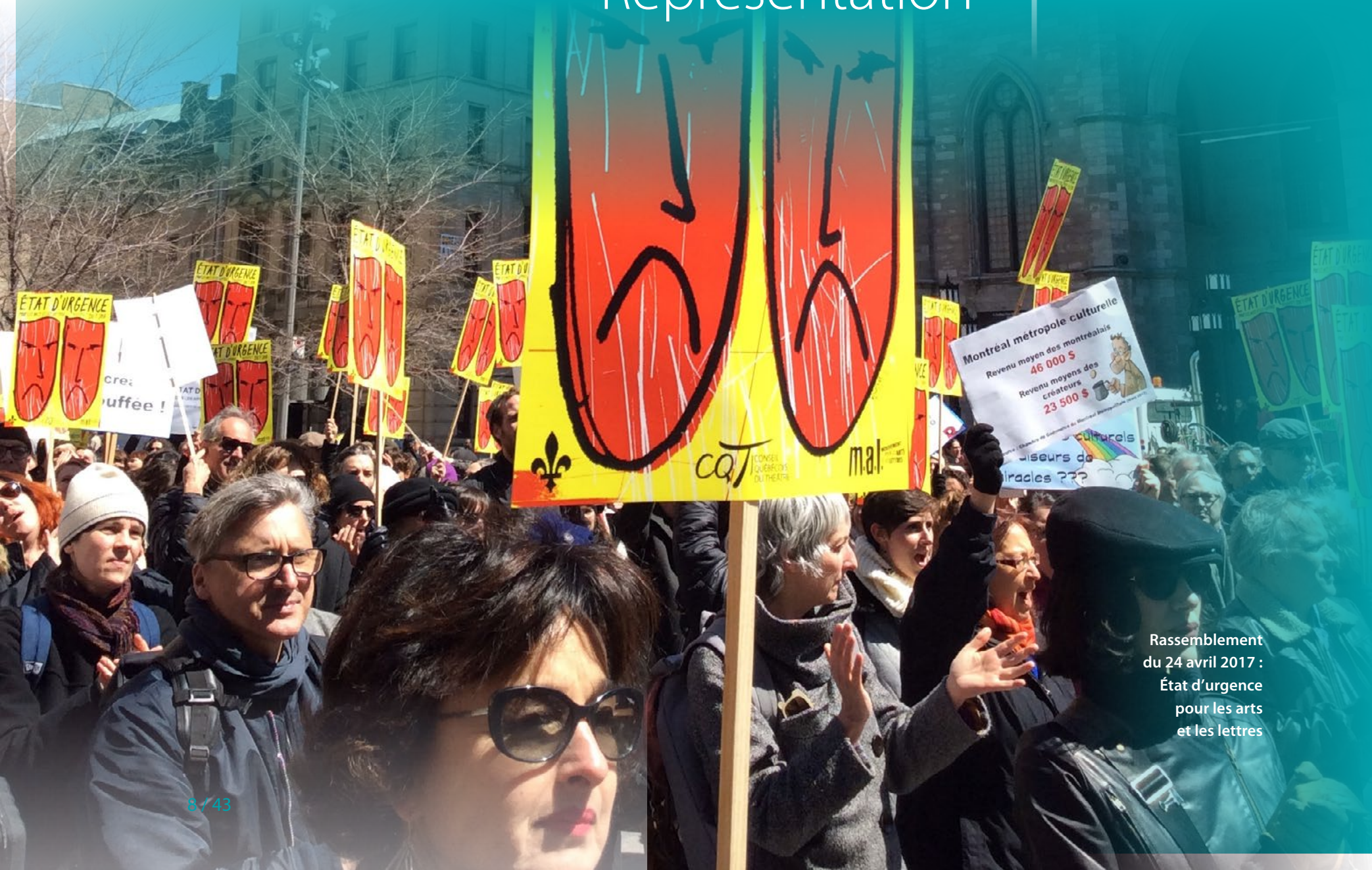
Rassemblement du 24 avril 2017 : État d'urgence pour les arts et les lettres